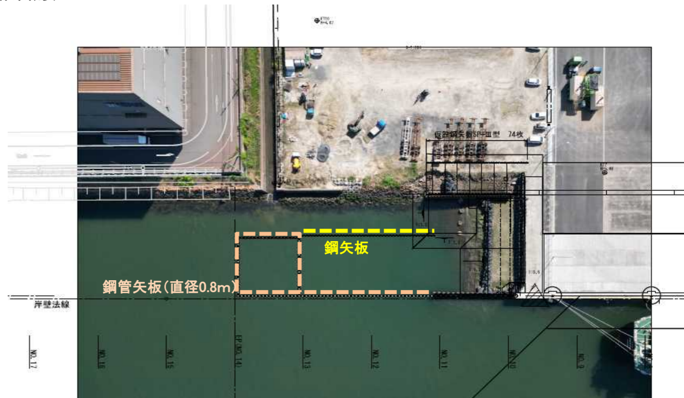
作業状況図 (鋼管矢板施工イメージ)